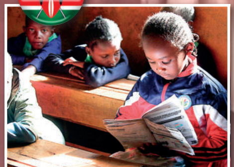
Für Kinder - KENIA