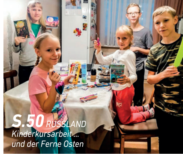
S.50 RUSSLAND Kinderkursarbeit ... und der Ferne Osten