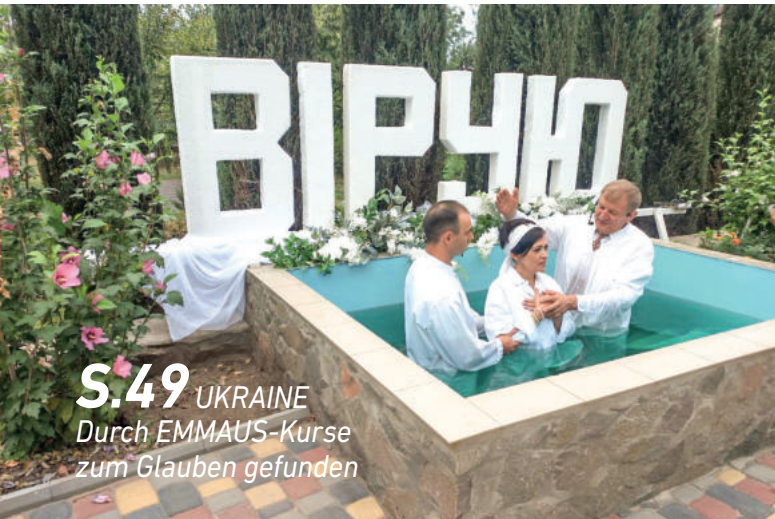
S.49 UKRAINE Durch EMMAUS-Kurse zum Glauben gefunden