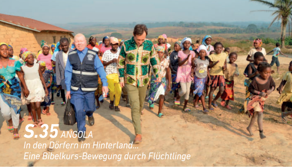
S.35 ANGOLA In den Dörfern im Hinterland... Eine Bibelkurs-Bewegung durch Flüchtlinge