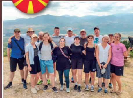
Im Einsatz - NORDMAZEDONIEN