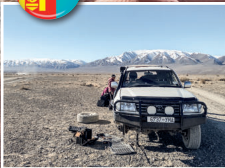
Auf Tour - MONGOLEI