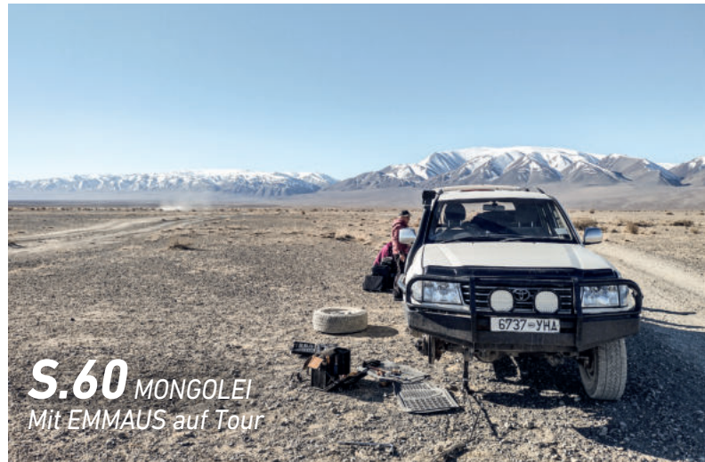
S.60 MONGOLEI Mit EMMAUS auf Tour